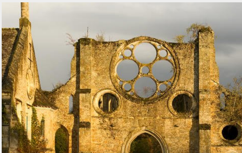
Abbaye des Vaux de Cernay (PNRHVC)