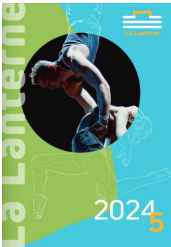
À La Lanterne